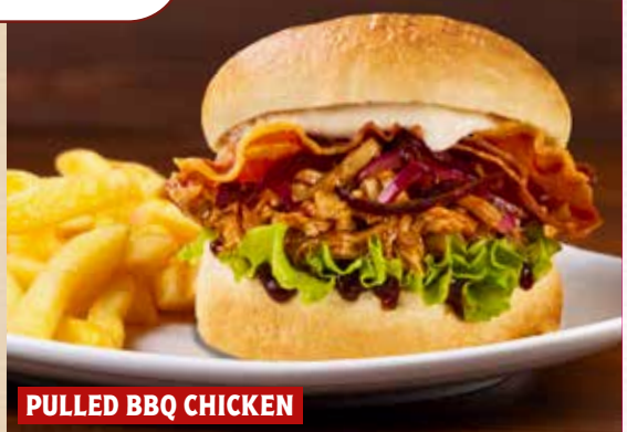
PULLED BBQ CHICKEN