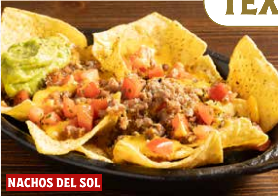
NACHOS DEL SOL