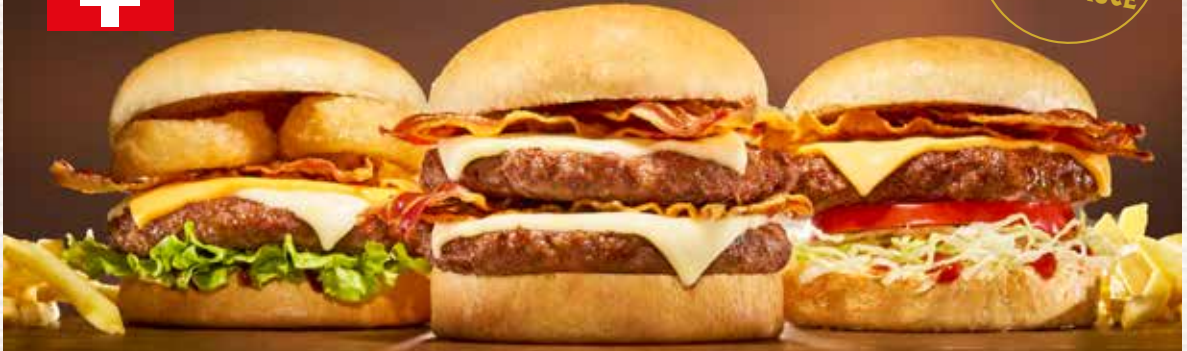
CHEESE & BBQ BURGER