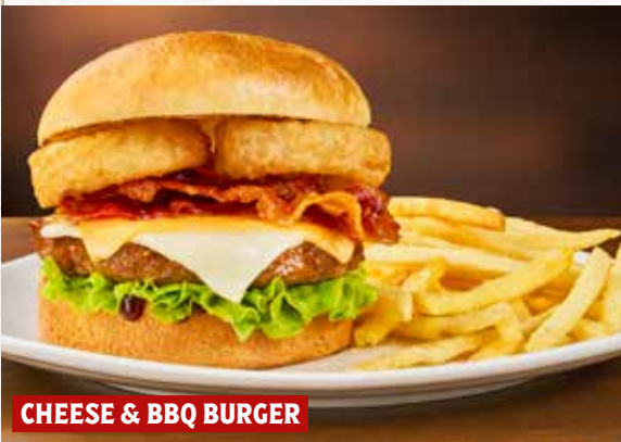
CHEESE & BBQ BURGER