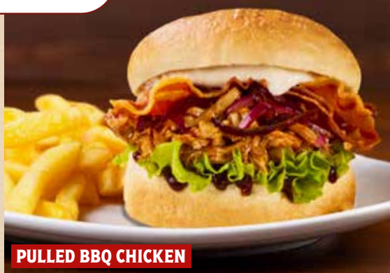
PULLED BBQ CHICKEN