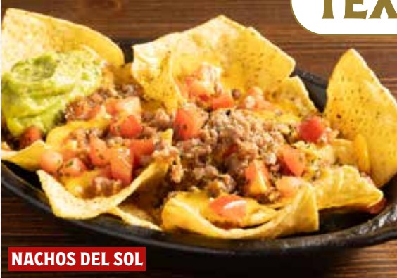
NACHOS DEL SOL