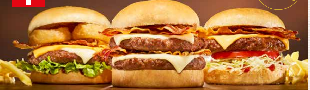
CHEESE & BBQ BURGER